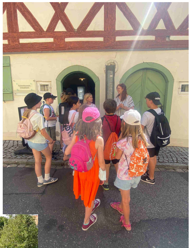
Ausflug mit den Reli-Schülern zur Synagoge in Schnaittach