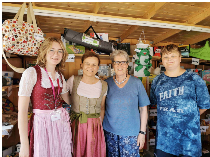
Kirwa mit Gottesdienst samt Band und Losbude, die der Kidstreff besuchte